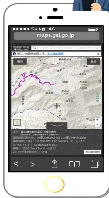
「現在位置周辺の地形図」を表示