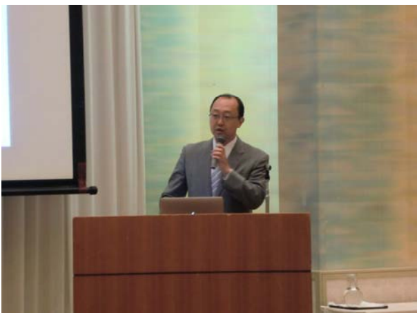
ウルシステムズ株式会社