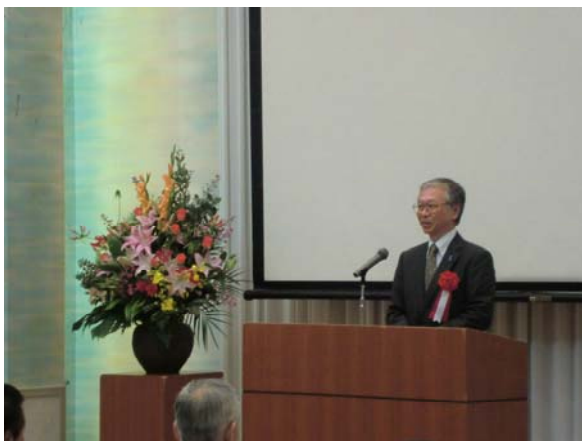
にいがた産業創造機構