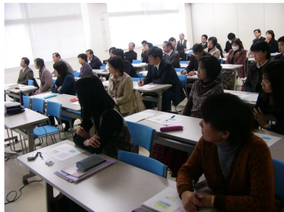
コミュニケーション能力の育成