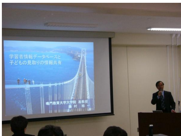
学習者情報データベースと子どもの見取りの情報共有