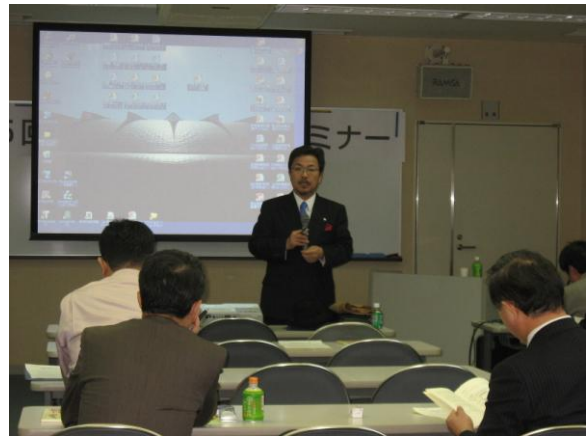
【IT部門】IT経営力養成セミナー