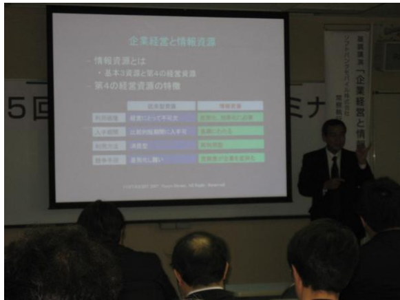
基調講演「企業経営と情報活用」