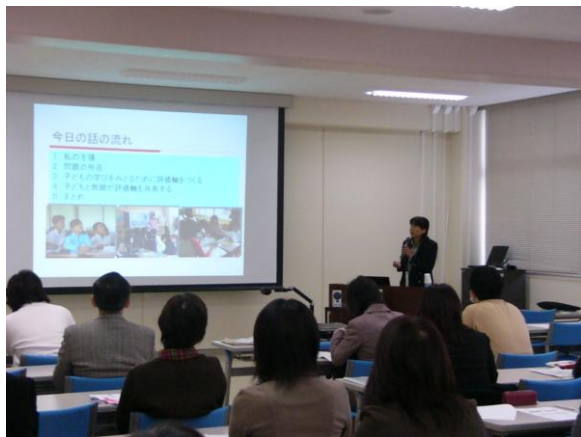
見える「評価」で授業が変わる！