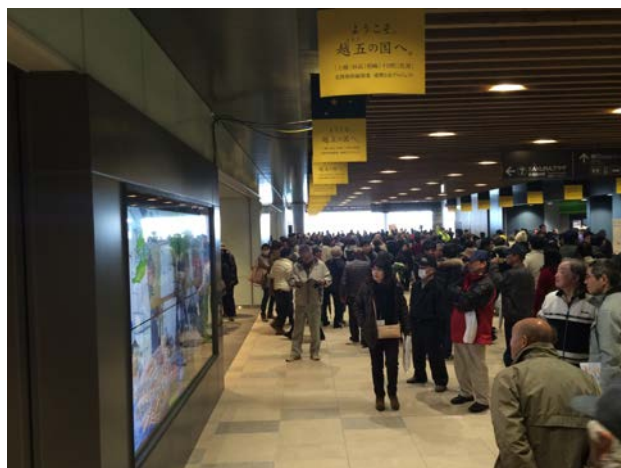
※北陸新幹線開業(3/14)の様子